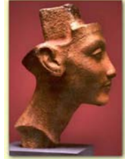
Sotto, profilo di Nefertiti e della mummia 61070