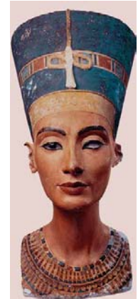
Famosa testa di Nefertiti con occhio sinistro opaco (museo di Berlino)