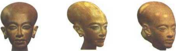
Crani decisamente dolicocefali di alcune figlie di Akhenaton e Nefertiti

Le forme dei crani delle figlie di Akhenaton e Nefertiti sono particolarmente intriganti, come se in esse la Sindrome di Marfan si sia manifestata in modo particolarmente grave.