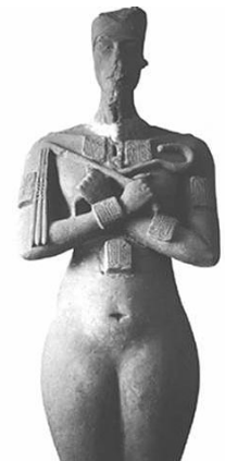
Statua di Akhenaton, asessuata o con caratteristiche femminili (museo del Cairo)

La possibilità che Akhenaton fosse una donna giustificerebbe, almeno in parte, il suo aspetto fisico e i suoi atteggiamenti materni e renderebbe abbastanza comprensibile il livello paritetico del re e della regina, Nefertiti, la quale, forse per essere stata Sposa Reale di Amenhotep III, dovette godere di privilegi eccezionali, come se i due sovrani si siano divisi i compiti, dedicandosi Akhenaton per lo più alla religione e all'arte e Nefertiti alla vita pubblica e alla gestione amministrativa del regno.