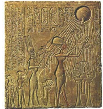
Akhenaton, Nefertiti e due delle loro figlie

Queste caratteristiche hanno portato molti studiosi a considerare la possibilità che una malattia del faraone abbia suggerito una