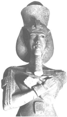
Busto di Akhenaton con occhio destro chiuso (museo del Cairo)