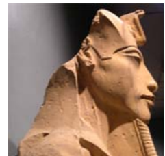
Tre rappresentazioni di Akhenaton in sequenza temporale