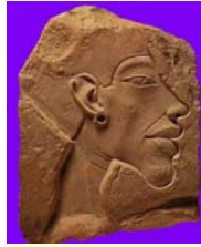
Sopra, profilo di Akhenaton e della mummia 61072