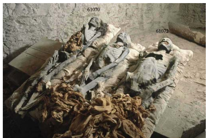
Le tre mummie ancora non identificate, trovate nella tomba di Amenhotep II nella Valle dei Re

Ulteriori segni della malattia possono essere colti infine in due statue nelle quali i due sovrani sono rappresentati con un evidente difetto ad un occhio, quello sinistro nella bellissima testa di Nefertiti, e quello destro in una delle tante statue di Akhenaton, come se il realismo artistico del periodo abbia voluto immortalare la grave malattia agli occhi, glaucoma e/o cataratta, che quasi sicuramente colpì i sovrani.